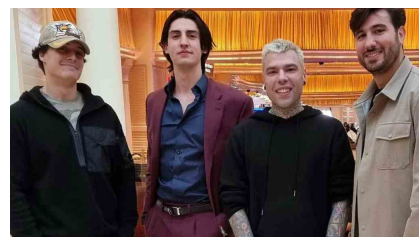
La storia di Fedez e del Campione Mondiale di memoria cacciati da un casinò di Las Vegas | VIDEO