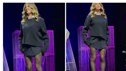
Alessia Marcuzzi mostra le gambe "storte" sul palco: "Il nostro difetto è la nostra unicità"