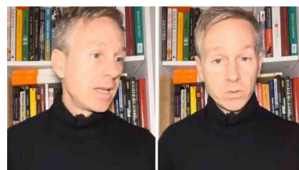
"Vi uso come cose", l'ultimo delirio di onnipotenza di Alessandro Orsini | VIDEO