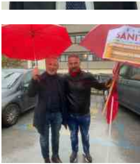
gli interessi erano 6, questo... ...a ricoprire i prore... ...a lucane. Di tutto ciò... ...azioni amministrati...