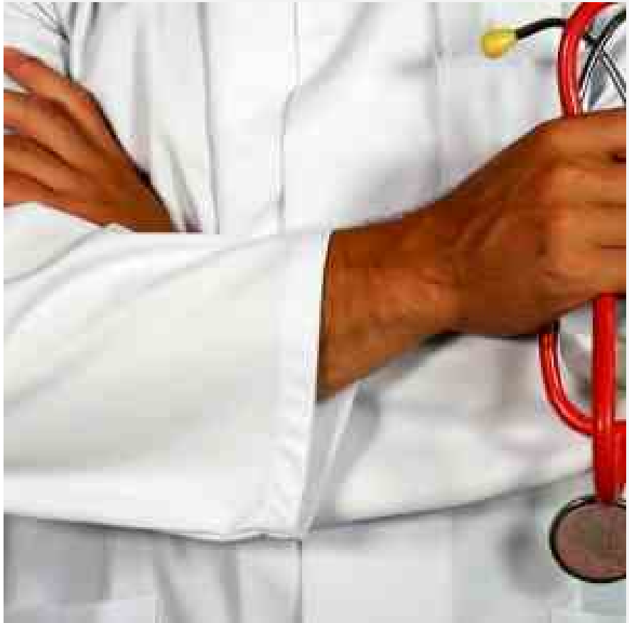
Arriva la firma definitiva del contratto nazionale del Comparto Sanità.