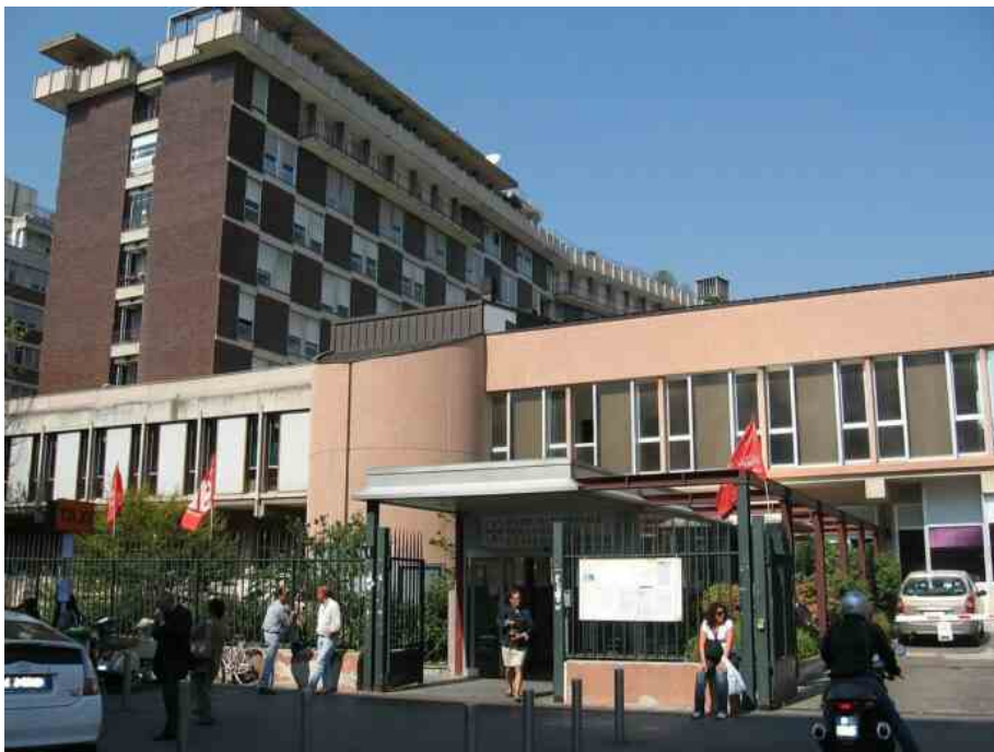
Istituto Nazionale Tumori di Milano tra le Aziende sanitarie finaliste

VARESE, 18 ottobre 2022- La Lombardia è fra le tre Regioni italiane in cima alla classifica del Lean Healthcare Award 2022, gli Oscar della sanità , con ben quattro aziende sanitarie candidate alla premiazione finale. Gli Oscar della sanità promuovono le migliori innovazioni nel campo della salute e del servizio al cittadino. Tra le 25 sfidanti troviamo l'ASST Nord Milano, la Fondazione IRCCS Istituto Nazionale dei Tumori Milano, la Fondazione Poliambulanza Istituto Ospedaliero Brescia e l'Humanitas Research Hospital di Milano.