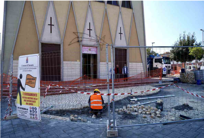
emiliano Tamburi (2)

Terminati questi lavori, la rigenerazione del quartiere continuerà con altri interventi , come la foresta urbana nord, il completamento del mercato rionale, il lungomare terrazzato su Mar Piccolo e il campo di calcio con annesse aree a verde sul sedime dell'ex impianto "Atleti Azzurri d'Italia", per un investimento totale di ulteriori 40 milioni di euro.