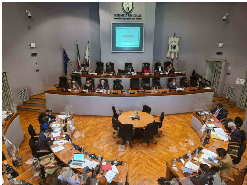
Il consiglio regionale delle Marche

Di Annalisa Appignanesi - 30 Settembre 2022