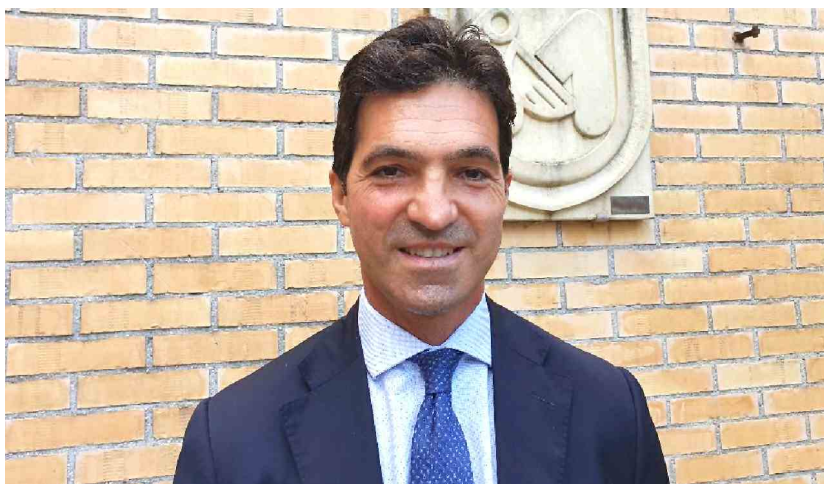
Francesco Acquaroli, presidente della Regione Marche

«Cordoglio alle popolazioni» colpite dall'alluvione del 15 settembre scorso «in particolar modo alle famiglie, ai cari e agli amici delle persone che hanno perso la vita in questo momento drammatico». Lo ha espresso il presidente della Regione Marche, Francesco Acquaroli , nell'Aula del Consiglio regionale dove la seduta è iniziata con un minuto di silenzio. Il governatore ha proposto all'Assemblea Legislativa una seduta straordinaria e monotematica dedicata all'alluvione che è stata calendarizzata per l'11 ottobre.