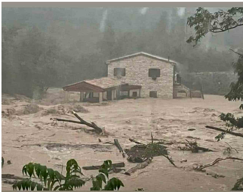
L'alluvione a Cantiano