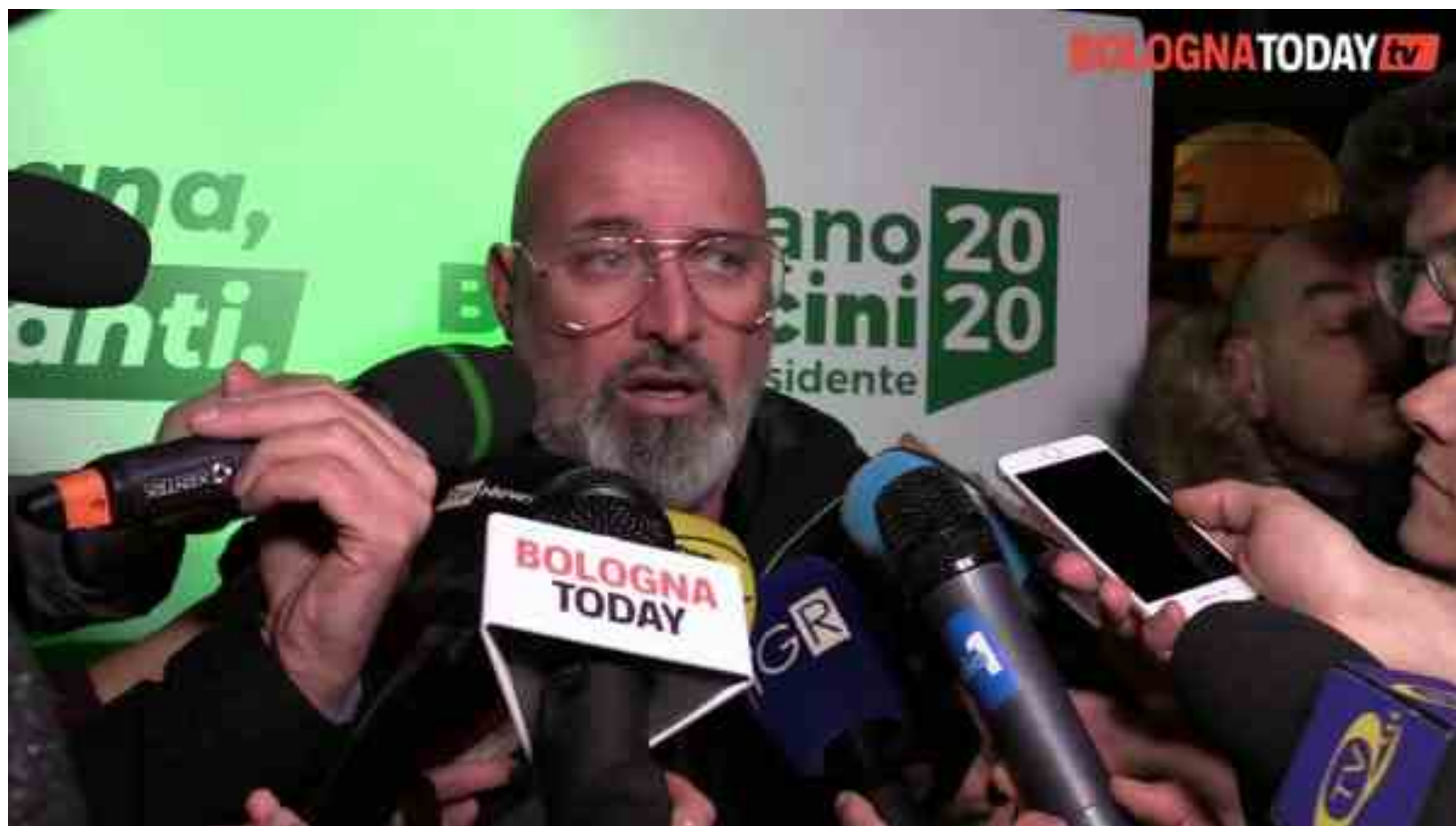
Stefano Bonaccini

S i candiderà alla guida del Pd "solo se sarà utile alla rinascita del partito". Lo ha detto il presidente della Regione, Stefano Bonaccini, ospite ieri nello studio di Otto e mezzo, su La7, dopo l'annuncio del segretario dem, Enrico Letta, che non si ricandiderà a guidare il partito, uscito "male" dai seggi del 25 settembre.