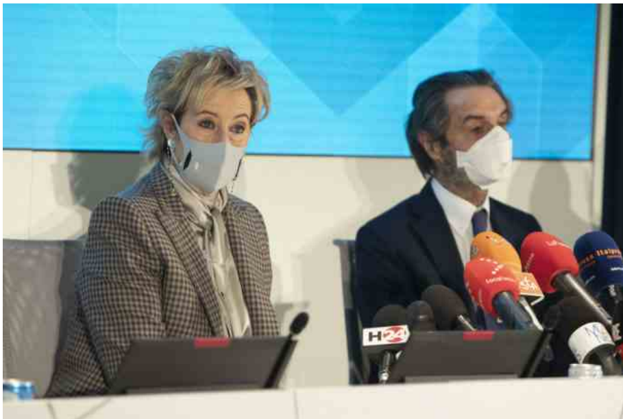
LETIZIA MORATTI VICEPRESIDENTE REGIONE LOMBARDIA ASSESSORE WELFARE ATTILIO FONTANA PRESIDENTE REGIONE LOMBARDIA

Letizia Moratti ribadisce la disponibilità a candidarsi alle prossime regionali e in tv afferma: "Fontana mi promise un passaggio di testimone". Subito replica il governatore: "Moratti chiarisca, o è con noi o contro di noi". E' ormai strappo tra il presidente e la sua vice, in vista delle elezioni regionali del prossimo anno. "Sono stata chiamata dal presidente Fontana in un momento difficile e ho accettato per responsabilità e amore per la mia regione, con l'impegno parallelo di un passaggio di testimone a fine legislatura" ha detto Letizia Moratti, intervistata su Rai3 da Marco Damilano. "Ho lavorato e lavoro coerentemente a quell'impegno ma coerentemente a quelle indicazioni ho costruito anche una rete civica. La mia non è un'autocandidatura ma una disponibilità, è diverso". C'è stato "chi me lo ha chiesto ma per riservatezza istituzionale, finché il centrodestra non chiarirà la sua posizione non dirò chi".