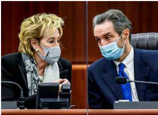
Letizia Moratti e Attilio Fontana

Letizia Moratti: "Fontana mi promise passaggio di testimone". Lui: "Falso, voglio un chiarimento". La Lega: "Dimissioni". Calenda: "Fatti del centrodestra"