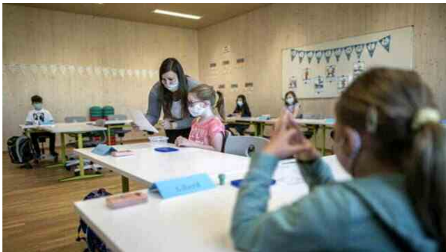
Immagine di repertorio

I l ministero dell'Istruzione ha reso note le indicazioni dell'Istituto superiore di sanità per gli istituti pubblici e privati dell'infanzia. Tra i punti principali: l'uso di mascherine Ffp2 per il personale a rischio di sviluppare forme severe di Covid e la permanenza a scuola consentita solo senza sintomi.