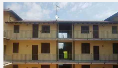
Appartamenti privata Gaio Giulio Cesare - 18816