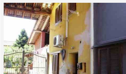
Appartamenti Motta Visconti San Giovanni - 26000