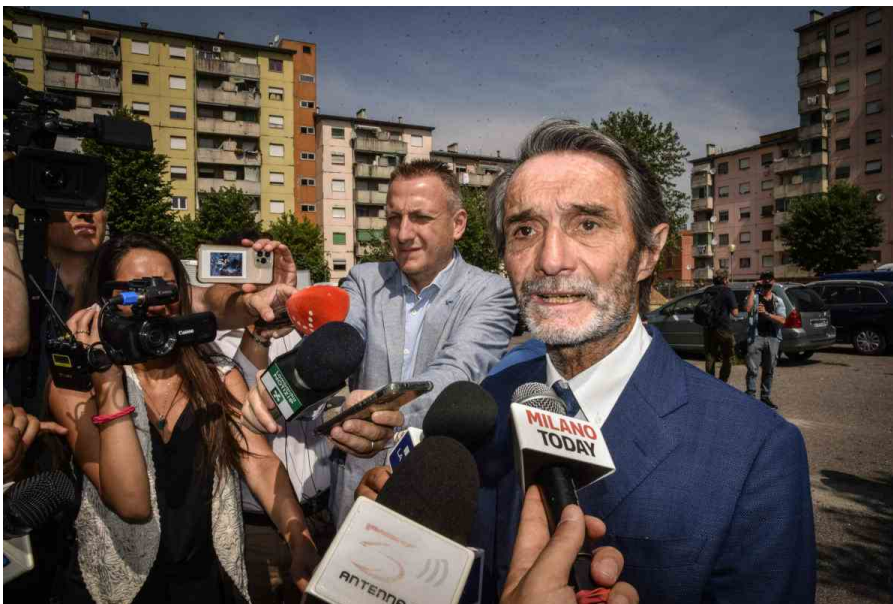
Il presidente di Regione Lombardia Attilio Fontana