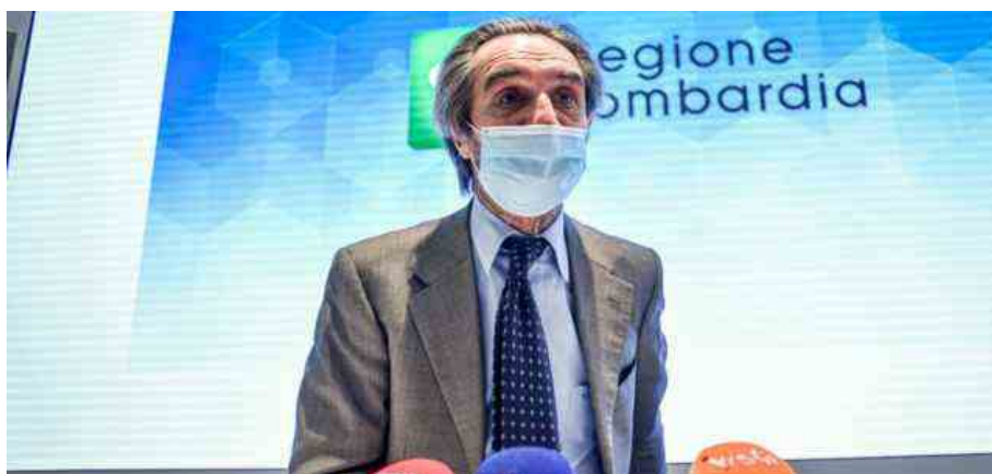
Attilio Fontana, Presidente Regione Lombardia

Attilio Fontana predica calma su nuova ondata Covid: "Nessun allarme. Con il premier Mario Draghi ho parlato di siccità e Reddito di cittadinanza, voglio licenziare navigator..."