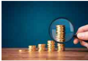
Fondo, quanto mi costi