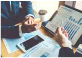
Consulenti sul Piano