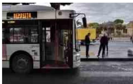
Sciopero dei trasporti a Roma venerdì 14 gennaio