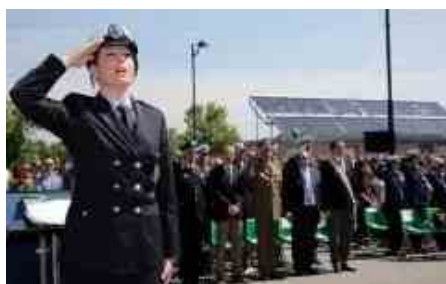
Il Sulpl proclama lo sciopero della Polizia locale