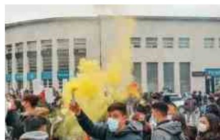
L'Unione degli Studenti proclama uno sciopero nazionale