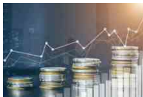
Focus sugli assicurativi