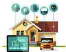
La casetta smart degli italiani