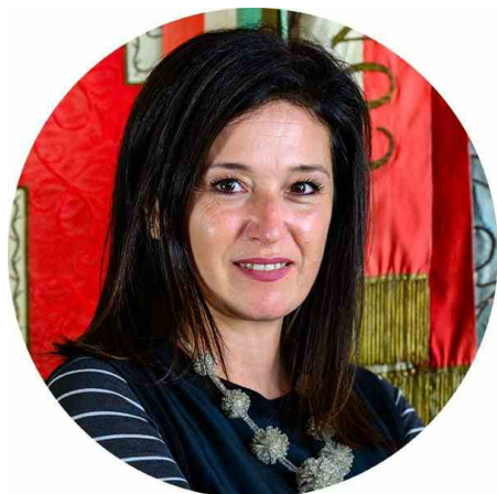
Elena Di Gioia

“Riteniamo di fondamentale importanza aprire il dibattito sui temi di studio affrontati da Ateatro, nell’ottica di valorizzazione e sostegno del sistema dello spettacolo dal vivo in un dialogo istituzionale di confronto con la filiera degli operatori e operatrici del settore” dichiara Elena Di Gioia delegata del Sindaco alla Cultura di Comune e Città metropolitana di Bologna. “Per questo siamo molto contenti di poter ospitare il pomeriggio di studio promosso da Ateatro contribuendo ai lavori ed allo sviluppo di una riflessione che ha un carattere nazionale e che porterà riflessioni anche sul fronte di nuove azioni e strumenti da mettere in campo”.