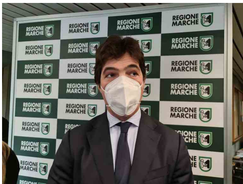
Francesco Acquaroli, presidente Regione Marche

Insomma se «il tracciamento rischia di avere un condizionamento forte» alla stessa maniera la carenza di sanitari influenza anche «altre strategie che stiamo portando a termine con convinzione come lo screening scolastico della popolazione delle elementari e medie, che verrà fatto anche alle superiori: fare uno screening significa interrompere un'altra azione, un altro servizio che si stava mettendo in campo».