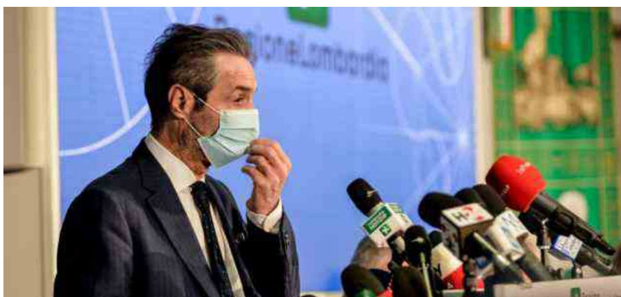
Attilio Fontana, Presidente Regione Lombardia

La Lombardia verso la zona gialla dal 3 gennaio: superate le soglie limite. Fontana "no quarantena a contatti di positivi vaccinati, sarebbe lockdown senza ristori"