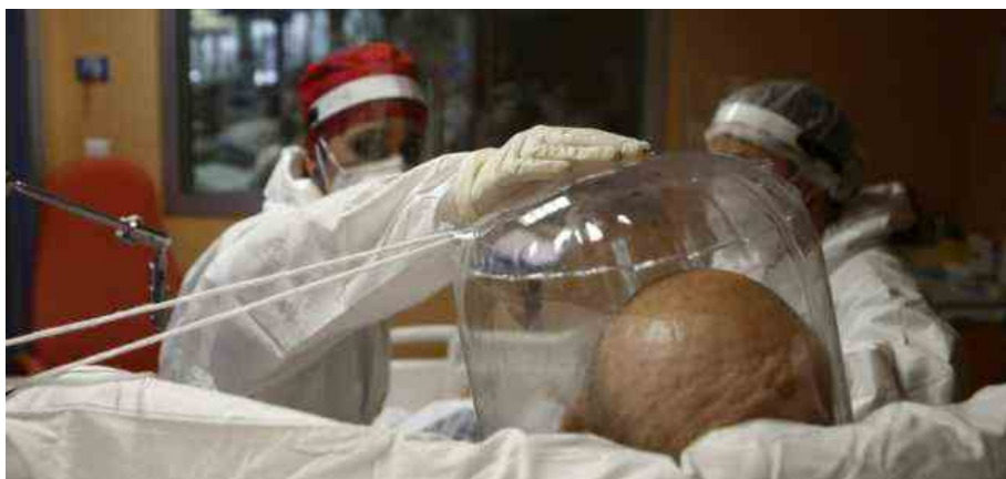
Coronavirus Italia, un reparto terapia intensiva

Bollettino coronavirus Ministero Salute 20 dicembre 2021: il consueto punto giornaliero sulla pandemia di covid in Italia. Ieri altri 24.259 contagiati