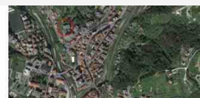
Foto 1 - Vista aerea del ciclo 150