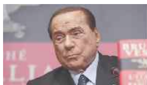
ANCORA RINVIATO IL PROCESSO A BERLUSCONI