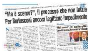
"MA È SCEMO?", IL PROCESSO CHE NON INIZIA PER