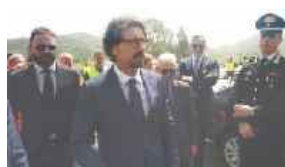
Danilo Toninelli "lo assente ieri al consiglio dei ministri"