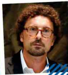
Berlusconi e Toninelli

presso il Tribunale di Potenza con udienze fissate, la prima ad aprile e la seconda a luglio scorso.