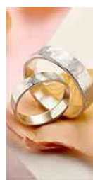
Scopri Prodotti Artigianali