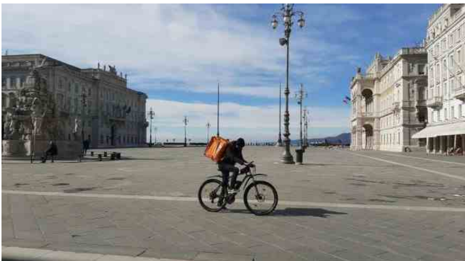
Piazza Unità d'Italia deserta a Trieste