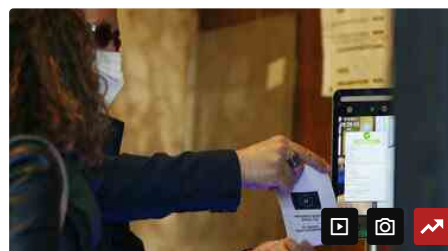
Super Green pass in zona arancione a dicembre e niente carta verde con i tamponi Come funzionerà