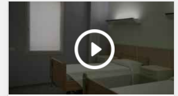
Genova, nell'ex Asl di Sestri Ponente inaugura la nuova Rsa Anni Azzurri