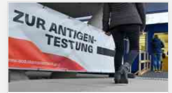
Covid, Austria in lockdown da lunedì. Dal primo febbraio obbligo vaccinale