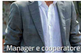
Manager e cooperatore