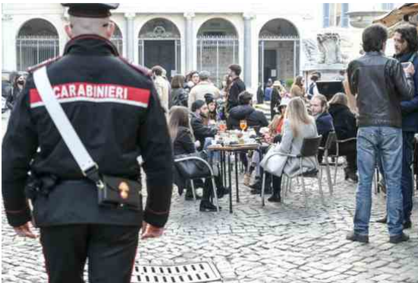
Controlli per il rispetto delle norme anti-Covid