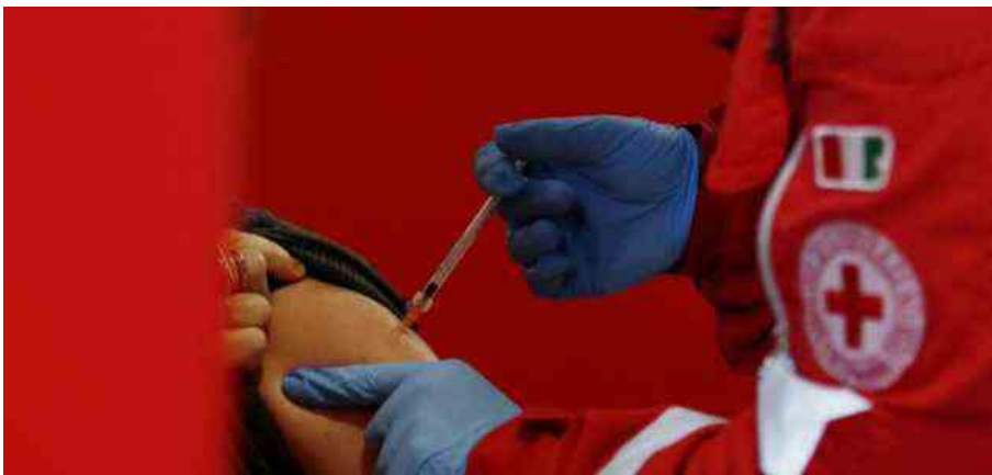
Hub vaccinale della Stazione Termini a Roma

Rt e incidenza settimanale per 100mila abitanti sono indicatori inaffidabili. Ecco quelli da guardare. Con un nota bene, che viene dal confronto con il 2020