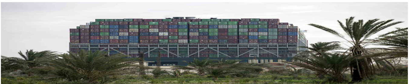
Liberata la nave Ever Given nel Canale di Suez