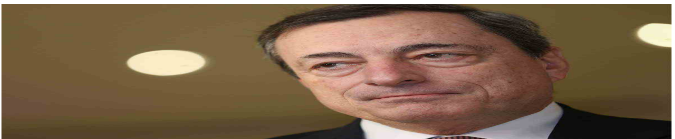
Atteso per oggi il vertice tra Governo e Regioni