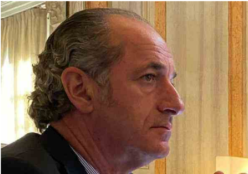
Zaia "Centralizzare la campagna vaccinale è medievale"

Nazionale - Zaia "Centralizzare la campagna vaccinale è medievale"