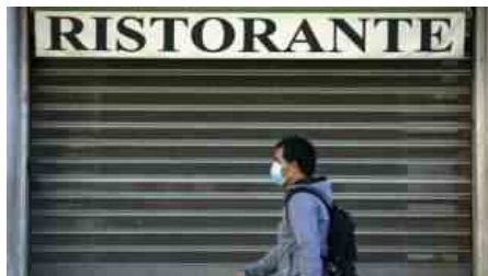
RISTORANTI CHIUSI LOCKDOWN 6

Il partito rigorista va ripetendo da giorni che l'incidenza dei contagi continua a essere alta, come anche la pressione sugli ospedali, per concludere che in queste condizioni l'unica soluzione è prorogare fino al 1° maggio le misure oggi in vigore, che dipingono l'Italia solo di arancione e rosso. Anche se, dopo l'impegno assunto da Draghi in Parlamento, sulla riapertura di scuole materne ed elementari non ci piove.