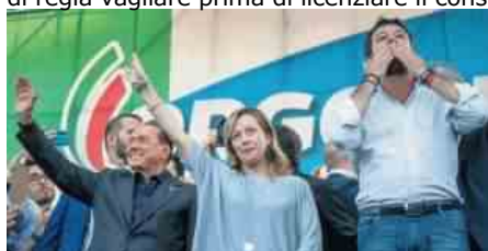
BERLUSCONI MELONI SALVINI

Condizione nella quale si troverà la Campania con il monitoraggio del Venerdì santo, che ne consacrerà il passaggio alla fascia arancione a partire dal 7 aprile. In bilico è il Veneto. Secondo i primi calcoli, il suo Rt a 1,22 è da arancione, ma l'incidenza dei contagi sarebbe a quota 254, che condanna di pochissimo al lockdown. Uno scarto minimo che spetterà oggi agli esperti della cabina tecnica di regia vagliare prima di licenziare il consueto monitoraggio settimanale.