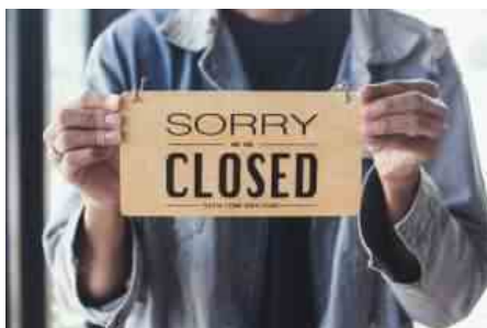
RISTORANTI CHIUSI LOCKDOWN

Intanto il monitoraggio di oggi promuoverà dal rosso all'arancione il Lazio a partire da lunedì prossimo per cinque giorni, perché da sabato a Pasquetta tutta l'Italia va in lockdown. Dove entra forse già da domani la Valle d'Aosta, Piemonte, Lombardia, Trentino, Friuli, Emilia-Romagna, Marche e Puglia resteranno rosse fino al 12 aprile, perché hanno ancora un'incidenza di casi e un Rt molto alti e per essere promossi occorre avere per due settimane numeri da arancione.