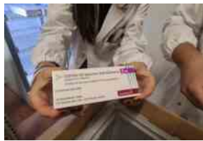
Vaccino AstraZeneca, possono prenotarsi anche i nati nel 1945