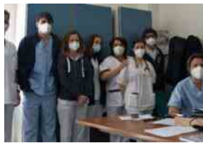
Un'ordinaria giornata di Covid