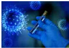
Coronavirus nell'aretino: 119 nuovi casi positivi, 127 persone ricoverate al San Donato