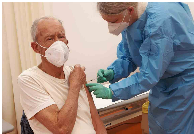
Vaccini al centro di un incontro con il governo nei prossimi giorni

Conferenza delle Regioni: Kompatscher chiede un incontro con il Governo per fare il punto sulle forniture di vaccini e Green Pass.