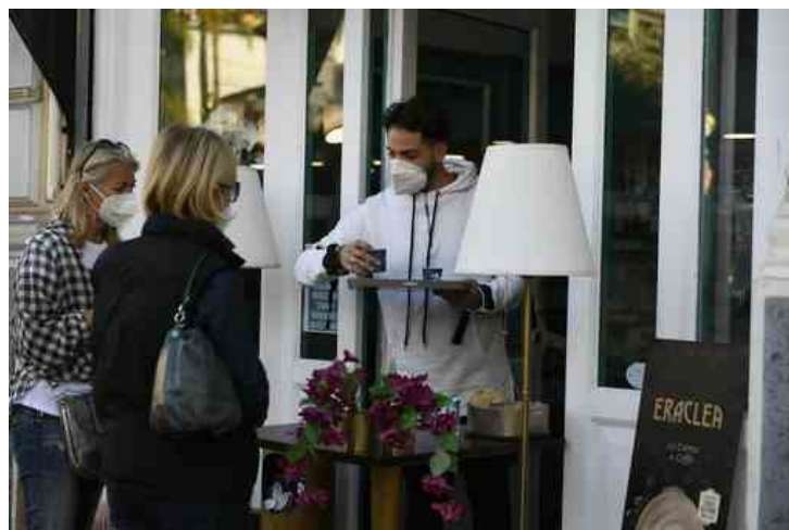
Si torna all'asporto da domani, con bar e ristoranti chiusi