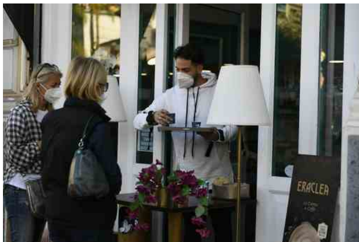
Si torna all'asporto da domani, con bar e ristoranti chiusi

Una situazione davvero difficile che, nel corso della giornata troverà sicuramente nuovi commenti e feroci proteste, che arriveranno a poche ore dalla manifestazione di ieri pomeriggio in piazza Colombo