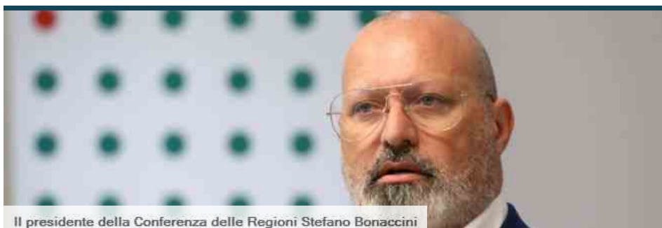
Il presidente della Conferenza delle Regioni Stefano Bonaccini

L'asse Salvini-Bonaccini preoccupa il segretario del Pd Nicola Zingaretti. Ma non è l'unico tormento per il leader dem.