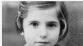
Giornata della memoria: