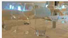
Pizzeria aperta con clienti