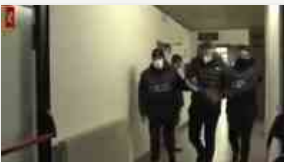
Fermata la banda dei