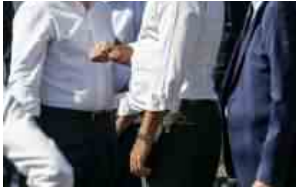
GIUSEPPE CONTE E NICOLA ZINGARETTI AI FUNERALI DI WILLY MONTEIRO