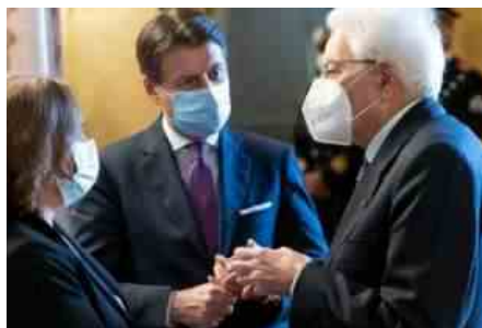
GIUSEPPE CONTE SERGIO MATTARELLA 1

In queste ore il premier Giuseppe Conte sta pensando di salire al Colle per dimettersi e provare così a varare il suo terzo governo con i responsabili-costruttori. Secondo quanto risulta al Foglio, a spingere su questa ipotesi sarebbero proprio i vertici del M5s. Un modo per evitare il voto di giovedì sulla relazione di Alfonso Bonafede, un passaggio che in Senato potrebbe far cadere il governo.