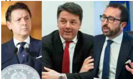
RENZI BONAFEDE CONTE

La faglia nel centrodestra attraverserebbe il partito di Berlusconi, tenuto sotto osservazione dai suoi alleati. Ai quali non è sfuggito l'atteggiamento del Cavaliere, che l'altro ieri ha proposto un governo di unità nazionale e al contempo le elezioni anticipate. Un'ambiguità a cui va aggiunta una battuta sul premier che il leader forzista ha confidato a Casini: «Conte non sarà granché ma si sta mostrando abile».