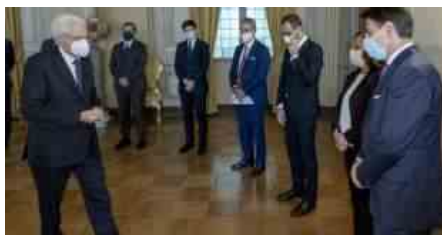
SERGIO MATTARELLA RICEVE IL GOVERNO

La mossa di Conte potrebbe arrivare tra martedì e mercoledì, c'è chi dice anche già domani sera. Il premier in questo modo punterebbe ad aprire una crisi pilotata convinto che ci siano i numeri per sostituire Italia Viva. O forse per aggiungere ai costruttori anche Matteo Renzi, qualora riuscisse a rientrare in maggioranza. Dal Quirinale sono in attesa di ricevere comunicazioni definitive. Il Capo dello Stato non segue l'evolversi della situazione,