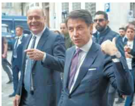
NICOLA ZINGARETTI E GIUSEPPE CONTE

Resterebbero i grillini. Ed è proprio nel partito di maggioranza relativa, rimasto ai margini del gioco, che si registrano forti tensioni. Ieri Di Maio ha abilmente inchiodato il capo del governo alle sue parole, ricordando che il premier aveva escluso un rientro di Renzi in coalizione. Poi ha sbarrato la strada al Conte 3, «perché se non ci sono adesso i voti per il Conte 2 non ci saranno neanche dopo». Infine gli ha dato «quarantott'ore». Traduzione: dato che a Palazzo Chigi hanno accentrato le trattative, adesso la sbrighino loro la situazione.