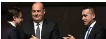
DI MAIO ZINGARETTI CONTE

Il passaggio dal Conte 2 al Conte 3 avverrebbe sotto la garanzia di una rete di protezione, una sorta di «crisi pilotata» che inizierebbe con le dimissioni del premier, passerebbe per la richiesta al capo dello Stato di un reincarico per formare un nuovo governo sulla base dell'«appello», e si concluderebbe con il voto di fiducia in Parlamento. Così verrebbe sancito un compromesso dal sapore democristiano che imporrebbe (quasi) a tutti un sacrificio.