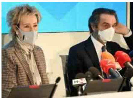
LETIZIA MORATTI E ATTILIO FONTANA

«Colpa di un algoritmo sbagliato». «Abbiamo inserito dati a caso in un campo privo di informazioni». «Noi non abbiamo validato i dati alla cabina di regia, li abbiamo validati nel senso che li abbiamo confermati». Ore 18 di ieri, il governatore lombardo Attilio Fontana, la sua vice Letizia Moratti e gli esperti della sanità regionale decidono di fare chiarezza sul gran pasticcio dei numeri del contagio che hanno blindato per una settimana la Lombardia in zona rossa quando in realtà era arancione. Conclusione: prima che Fontana si alzi e se ne vada spazientito e dopo spiegazioni dei tecnici che aggiungono perplessità su raccolta e trasmissione dei dati, il presidente invia il suo messaggio all'esecutivo