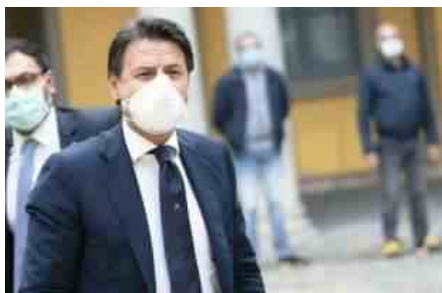
GIUSEPPE CONTE A BERGAMO CON MASCHERINA

Ecco allora che nel governo si fa largo una nuova strada per tenere la curva sotto controllo senza smentire l'ultimo Dpcm. Arrivare al fine settimana con l'Italia «chiusa» per Covid, con un piano scandito dalle ordinanze del ministro della Salute, dei governatori e dei sindaci per bloccare il più possibile la mobilità. Un lockdown «leggero», che consentirebbe alle imprese, alle fabbriche e alle professioni di andare avanti, ma chiuderebbe bar e ristoranti su quasi tutto il territorio nazionale, limitando il più possibile gli esercizi commerciali.