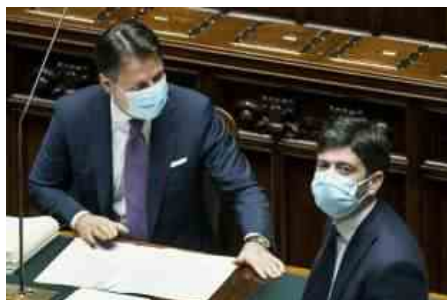
GIUSEPPE CONTE ROBERTO SPERANZA