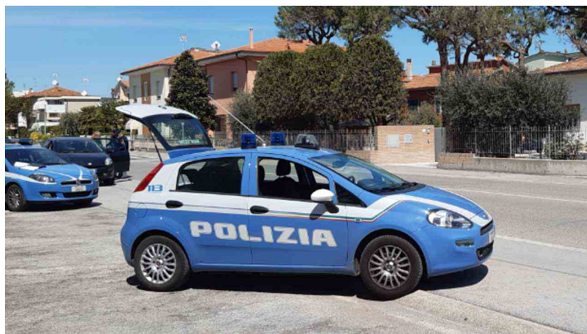
I controlli della polizia a Senigallia

Di Lorenzo Ceccarelli - 18 Settembre 2020