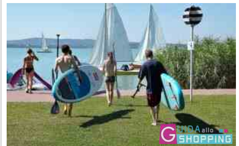
Tavola da Sup (stand up paddle), le migliori per praticare lo sport del momento