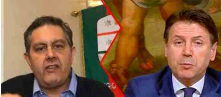
Ponte Morandi, Giovanni Toti attacca il governo

Il ministro delle Infrastrutture De Micheli conferma che il Ponte Morandi di Genova sarà gestito da Autostrade dei Benetton. Giovanni Toti indignato