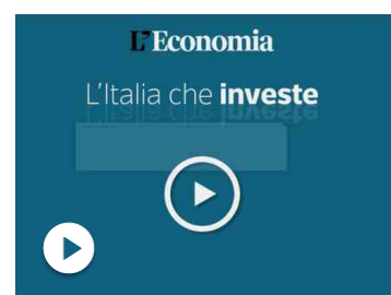
Da Miroglio a Barilla, l'Italia che investe