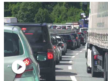
Da Milano a Genova Voltri in coda: 4 ore e 30 minuti, la rab...