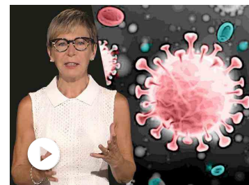
Covid-19, ecco come e perché la Lombardia è stata travolta | ...