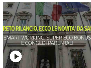
Decreto rilancio, ecco le novità da sapere