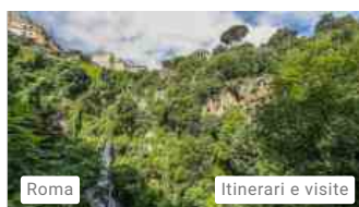
Roma Itinerari e visite