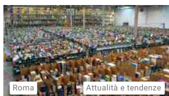
Roma Attualità e tendenze

Scopri cosa fare oggi a Roma consultando la nostra agenda eventi. Hai programmi per il fine settimana? Scopri gli eventi del weekend .