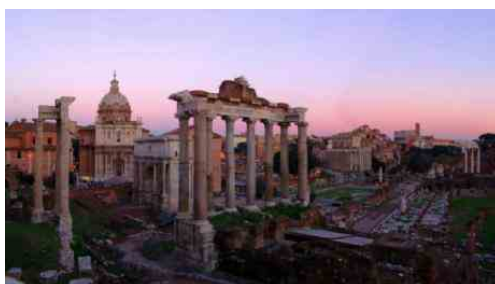
Fori Imperiali

riaprono al pubblico tutti gli spazi del Sistema Musei in Comune di Roma Capitale , Assessorato alla Crescita Culturale - Sovrintendenza Capitolina ai Beni Culturali. Si può così tornare a vivere di persona tutti i musei civici, spazi di cultura e bellezza, visitando le loro