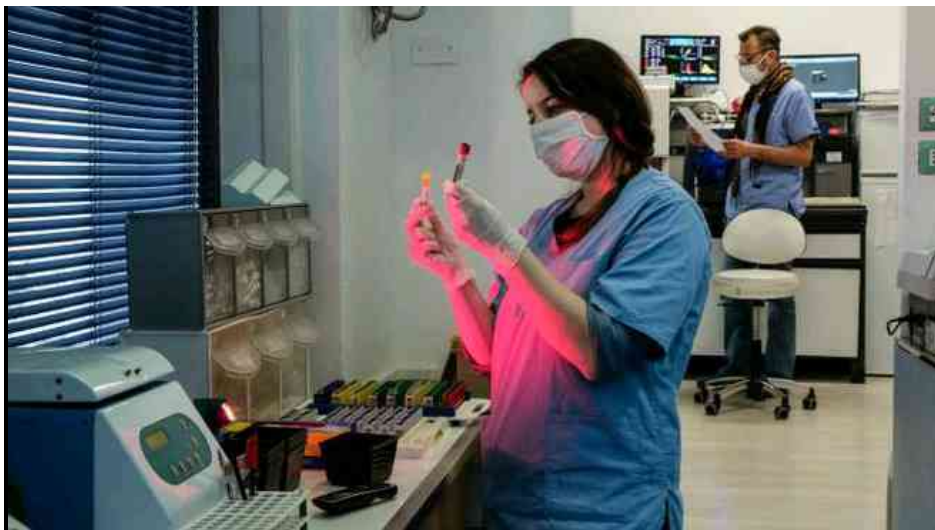
Coronavirus, analisi di laboratorio

Bologna, 28 maggio 2020 - Risale il numero dei contagi da coronavirus in Emilia-Romagna a fronte però di un incremento anche nel numero dei tamponi effettuati: in 24 ore in regione si registrano 74 nuovi casi e 11 nuovi decessi . Da ieri sono stati effettuati 9.128 tamponi. Sono 77, uno in meno rispetto a ieri, i ricoverati in terapia intensiva.