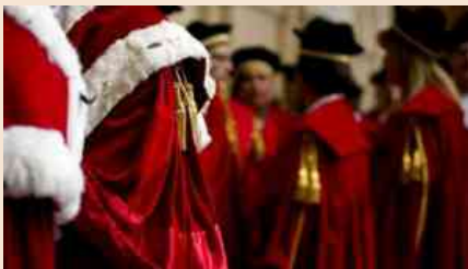
Il Csm da riformare

Le intercettazioni che stanno uscendo in questi giorni delineano una classe di magistrati non proprio in linea con il proprio ruolo . Più impegnata a copiare la politica che ad amministrare la Giustizia.