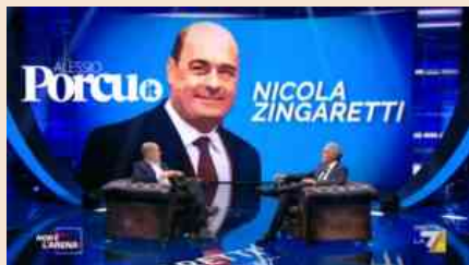
Nicola Zingaretti con Massimo Giletti a Non è l'Arena

È un Segretario nazionale che punta tutto sulla sostanza. Nei giorni scorsi lo hanno rimproverato perché non accende nessuna polemica . A differenza di Matteo Renzi che conquista un titolo di quotidiano al giorno proprio grazie alle polemiche. O del centrodestra che della politica urlata ha fatto la sua cifra. La battaglia contro il Covid-19 lo ha asciugato ancora di più. A Massimo Giletti Nicola Zingaretti dice “Io sono criticato perché faccio poche polemiche. Ma io, dopo il Covid, sono ancora più stanco di prima della politica parolaia” .