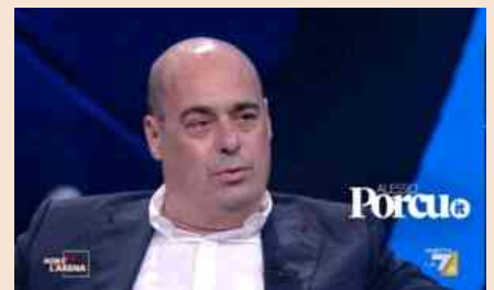
Nicola Zingaretti nello studio di Non è l'Arena

“Sta accadendo qualcosa che non è mai accaduto e quindi bisogna essere prudenti. Le regole fondamentali sono tre: distanza sicurezza, mascherine e lavarsi le mani. E poi una nuova politica sanitaria. Chiedo al governo che i test sierologici siano dati a chi non se lo può permettere. ” Nicola Zingaretti rilancia così dagli schermi nazionali de La7 il concetto che aveva espresso in settimana durante una conferenza stampa che aveva scelto di tenere allo Spallanzani. Il luogo simbolo nel Lazio della lotta al coronavirus. (leggi qui La sfida di Zingaretti: vaccino italiano e obbligatorio ).