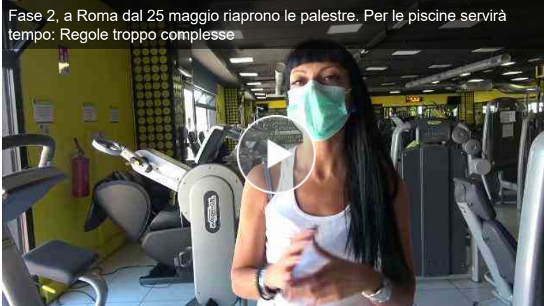
Fase 2, a Roma dal 25 maggio riaprono le palestre. Per le piscine servirà tempo: Regole troppo complesse