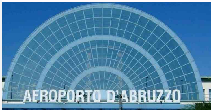
Aeroporto d'Abruzzo

A BRUZZO. E' approdato oggi nella Conferenza delle Regioni, grazie alla pronta ed incisiva presa di posizione sul tema del Presidente della Regione Abruzzo Marco Marsilio, il tema del mancato rimborso dello Stato agli Aeroporti rimasti aperti con decreto durante il periodo di lockdown, compreso lo scalo abruzzese.